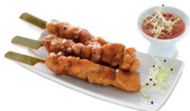
Bento yakitori poulet Bento yakitori saumon