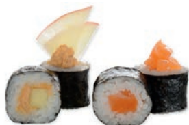
Funky maki 8 pièces 4 makis saumon, 4 thon cuit pomme